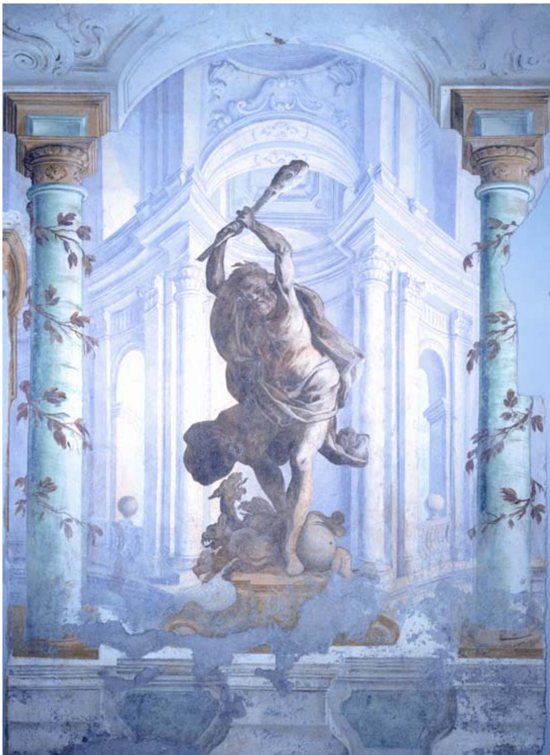
Artista napoletano ignoto (secolo XVIII) Ercole e l'Idra

datazione incerta affresco nella Sala del Consiglio