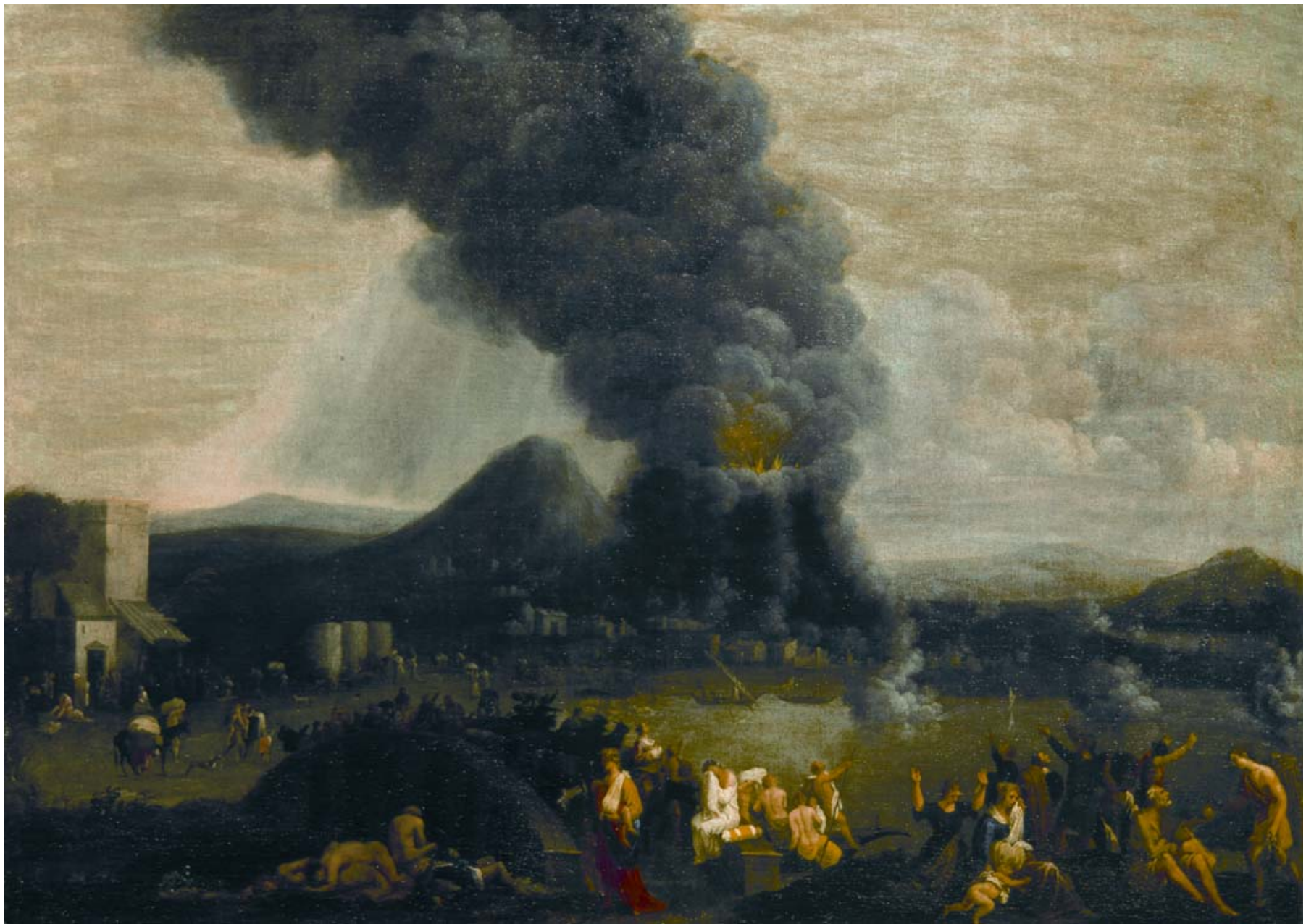
LORRAIN Claude (Chamagne 1600 – Roma 1682) Eruzione del Vesuvio