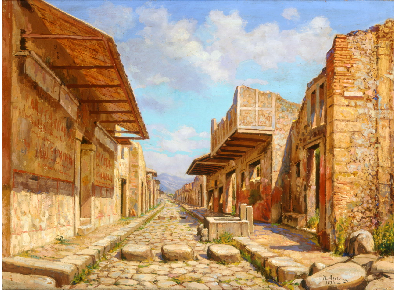
ASCIONE Nicola (secolo XX) Via dell'Abbondanza negli Scavi di Pompei