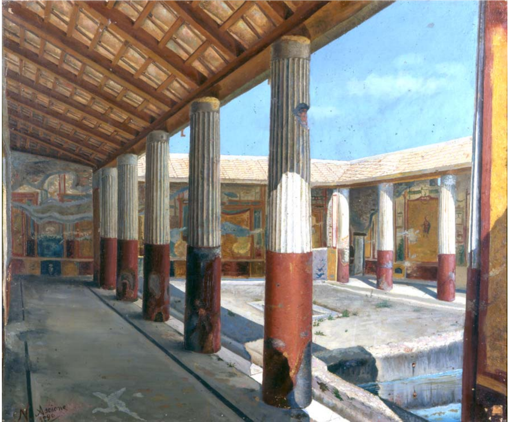
ASCIONE Nicola (secolo XX) Veduta di una casa degli Scavi di Pompei