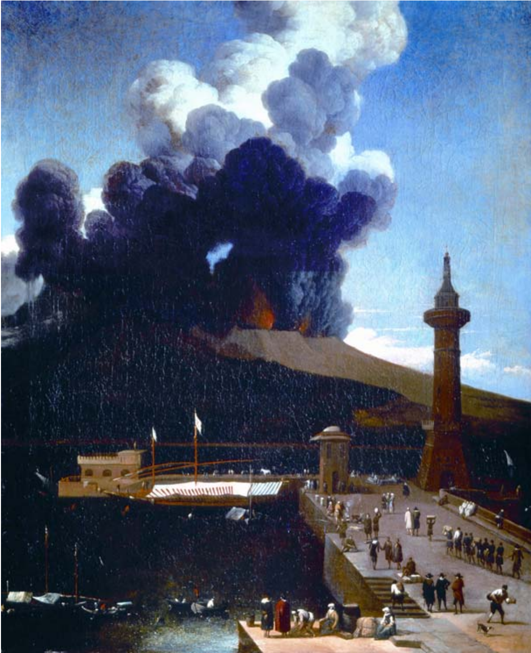
LINGELBACH Joannes (Francoforte 1622 – Amsterdam 1674) L'eruzione del Vesuvio dalla lanterna del molo di Napoli