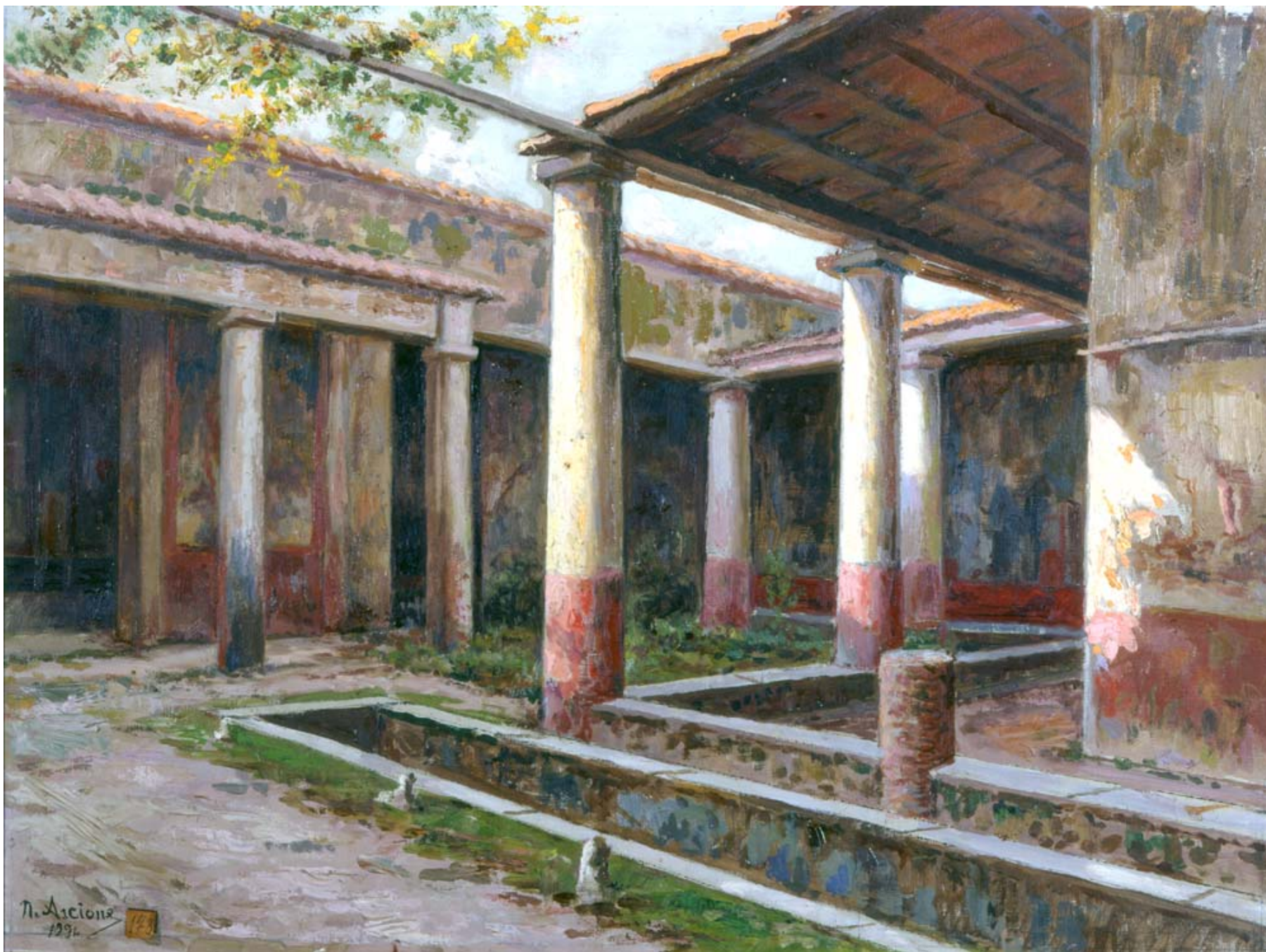
ASCIONE Nicola (secolo XX) Veduta di una casa degli Scavi di Pompei