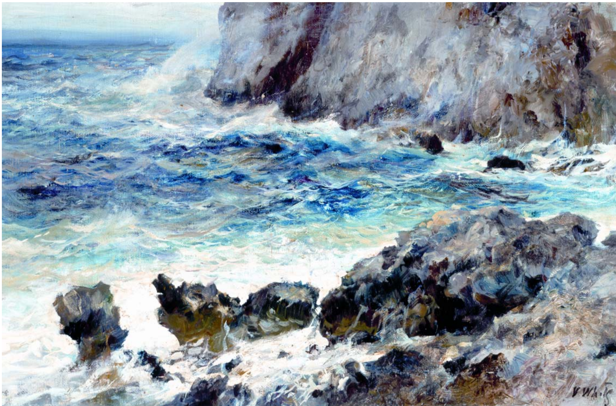
WHITE Valentino (secolo XX) Mare in tempesta