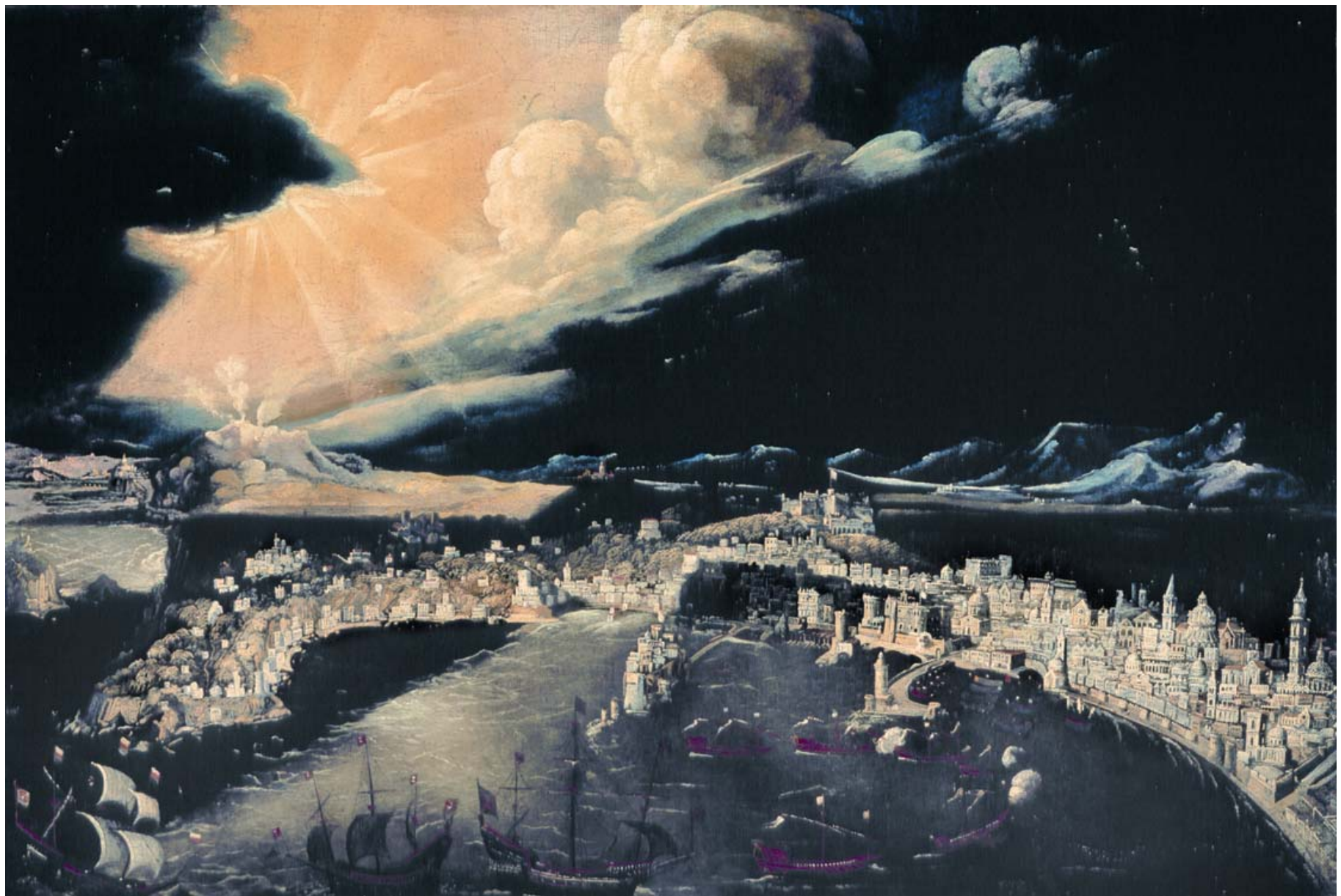
de NOME' Francois (Metz 1593 – ? 1649) Veduta di Napoli