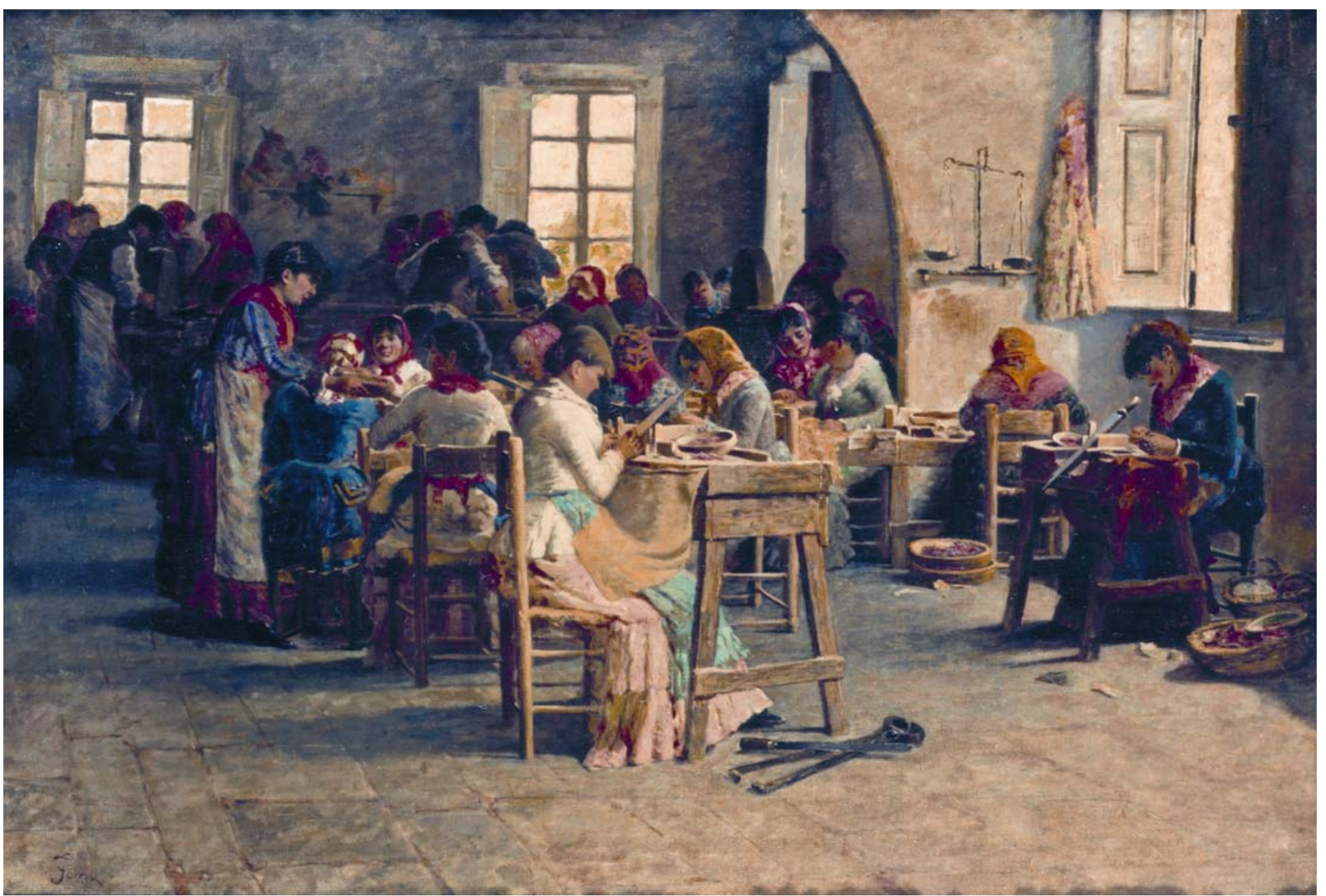
TOMA Gioacchino (Galatina 1836 – Napoli 1891) Le corallaie