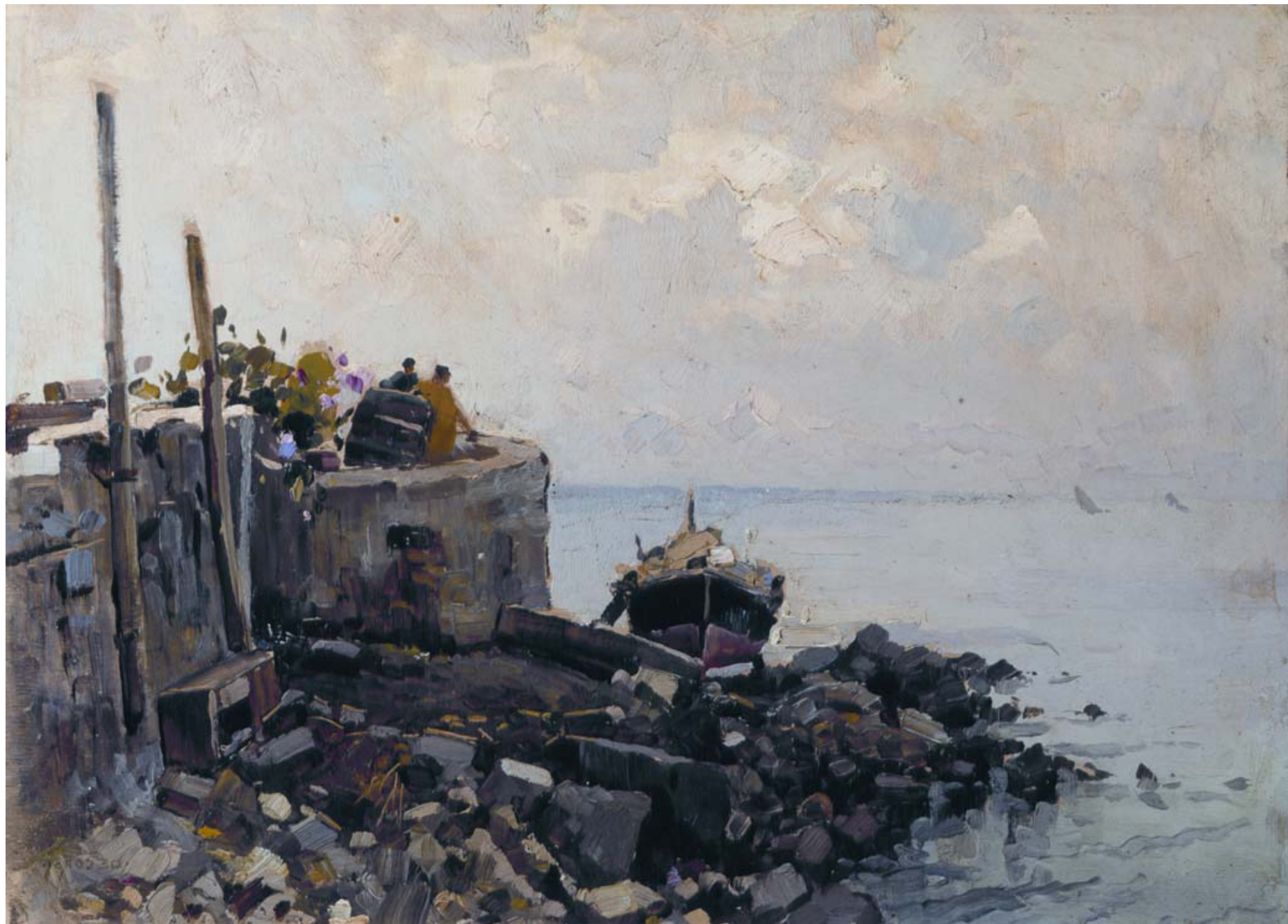
DE CORSI Nicola (? 1882 – ? 1956) Marina

datazione incerta olio su tavola 35 x 50