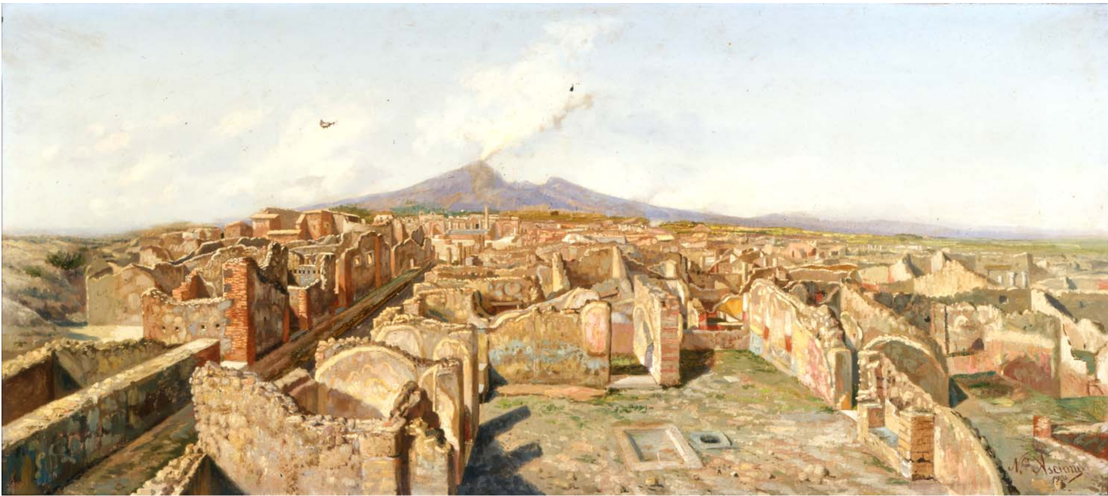
ASCIONE Nicola (secolo XX) Veduta a volo d'uccello degli Scavi di Pompei