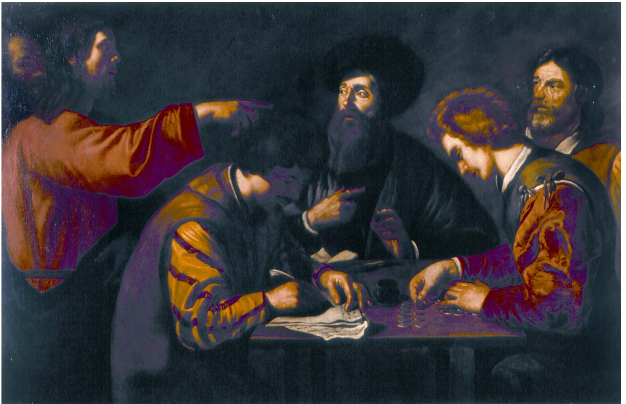
MANFREDI Bartolomeo (Mantova 1580 – Roma 1624) La conversione di San Matteo

attribuito al ... – anno 1620 ca. olio su tela 190 x 124