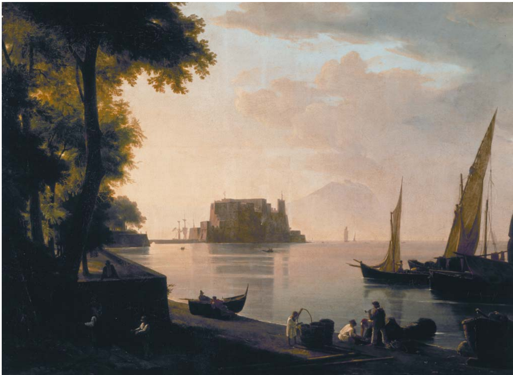
PITLOO Anton Sminck (Arnhem 1791 – Napoli 1837) Veduta di Castel dell'Ovo